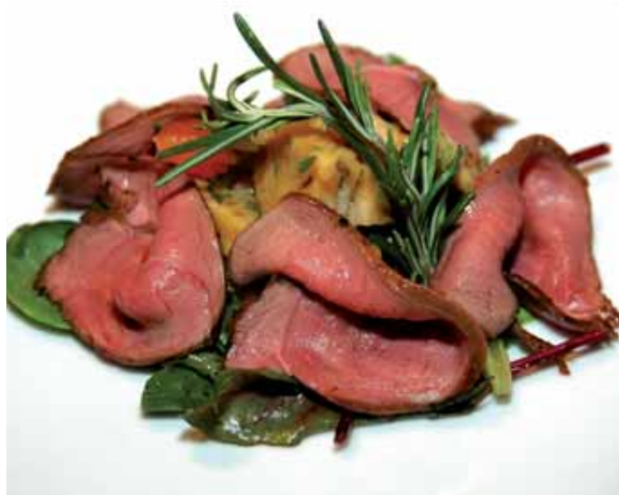
Al consumo dovrà giungere esclusivamente carne di selvaggina dai requisiti sanitari e organolettici ineccepibili; la figura del cacciatore ne uscirà di sicuro accreditata.