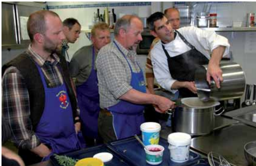
Anche le iniziative incentrate sull'impiego gastronomico del carniere aumentano la sensibilità per la tematica. Nella foto: corso di cucina nella riserva di Sarentino.